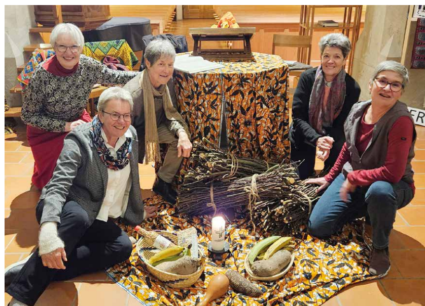
Vorbereitungsgruppe in Dinhard