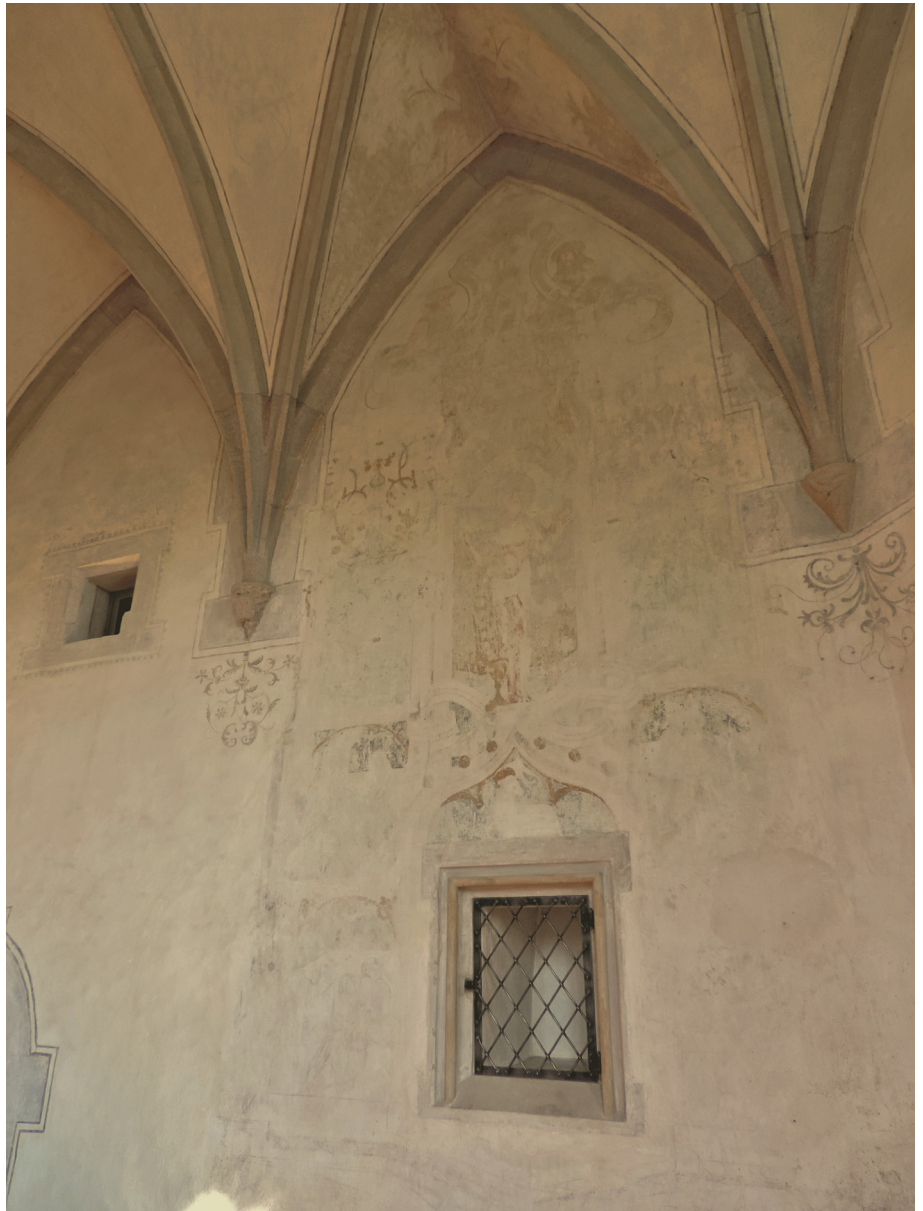
Malereireste im Chor, 1526

Ihnen kommt deswegen ein besonderes Gewicht zu, weil sie unvollendet geblieben sind. Deren Schöpfer waren im Gefolge der Annahme der Reformation in Dinhard 1526 gezwungen, ihre Arbeit einzustellen. Die Malereien sind daher aufs Jahr genau datierbar