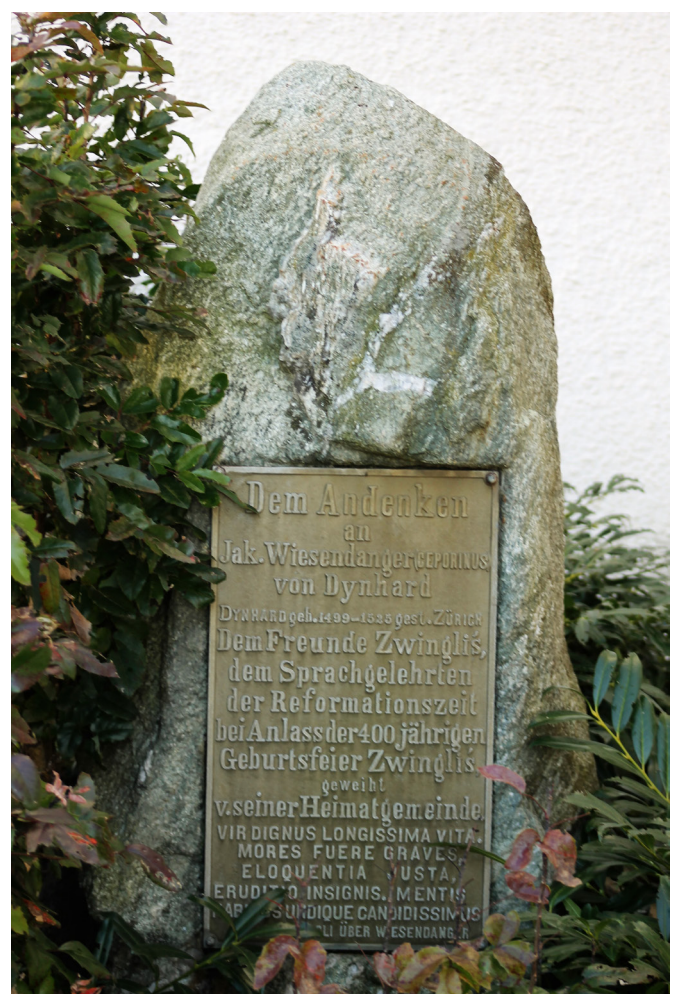
Gedenkstein Ceporinus am Glockenturm

den Ruf eines kompetenten und erfolgreichen Griechischlehrers. Im Rahmen eines Studienaufenthalts beim deutschen Humanisten und renommierten Hebräisten Johannes Reuchlin (1455 – 1522) in Ingolstadt erwarb er sich darüber hinaus gute Kenntnisse in Hebräisch. Ceporinus veröffentlichte eigene Schriften, unter anderem eine Zusammenstellung der griechischen Grammatik, die bis in die erste Hälfte des 18. Jahrhunderts in Gebrauch blieb. Mit dieser Grammatik stellte er auch seine didaktisch-pädagogischen Fähigkeiten