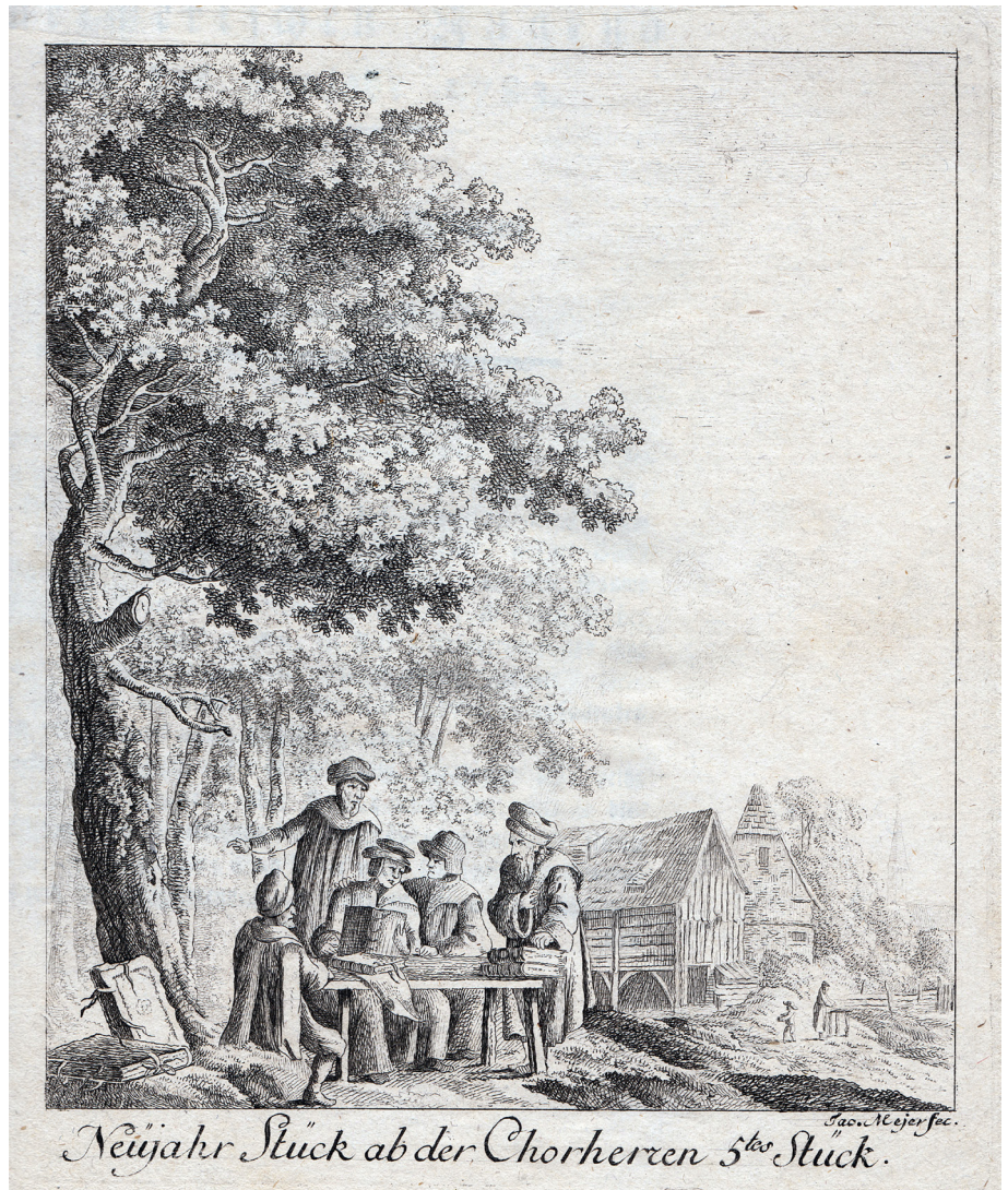
Neujahr Stück ab der Chorherren 5 tes Stück.

Die Gemeinde Dinhard widmete diesem bekannten „Sohn des Dorfes“ zum 400. Geburtstag