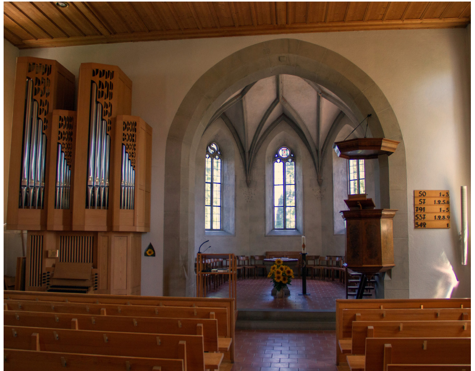
Der Innenraum heute

Aber die Kirche Dinhard hat eine lange Geschichte, die bis in das 8. Jahrhundert nach Christus zurück reicht. Das Gebäude, oder wenigstens einige seiner Teile, sind also älter als 1000 Jahre. Das heutige von aussen sichtbare Gebäude stammt aus den 1510er Jahren