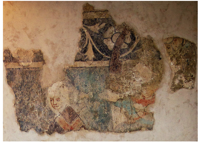
Reste der frühgotischen Malereien