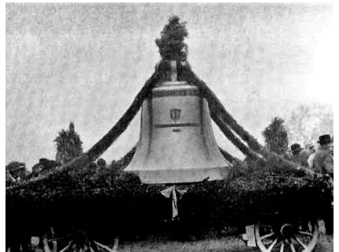
Transport einer der neuen Glocken, 1935

Die Glocken waren 1515, also rund 10 Jahre vor der Reformation, in den Turm hochgezogen worden und hatten seither den Dinhardern freudige und traurige Ereignisse verkündet. Aus klanglichen Gründen gab man im Jahre 1830 die mittlere Glocke Jakob Keller in Unterstrass bei Zürich zum Umgiessen.