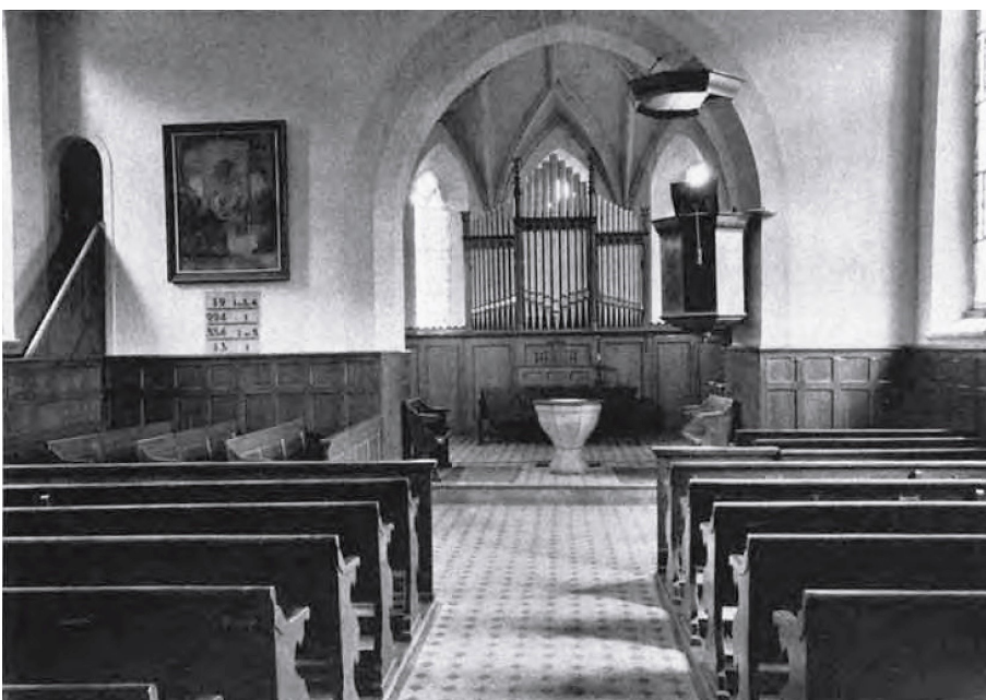
Der Innenraum vor 1972