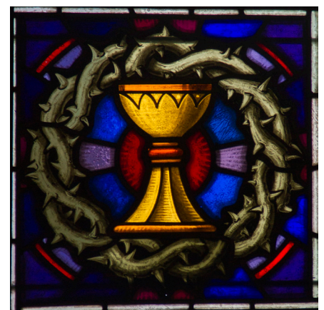
Details der Kirchenfenster von 1931

deckte ursprüngliche Profil über den ganzen Bogen in Sandsteinmasse gezogen.