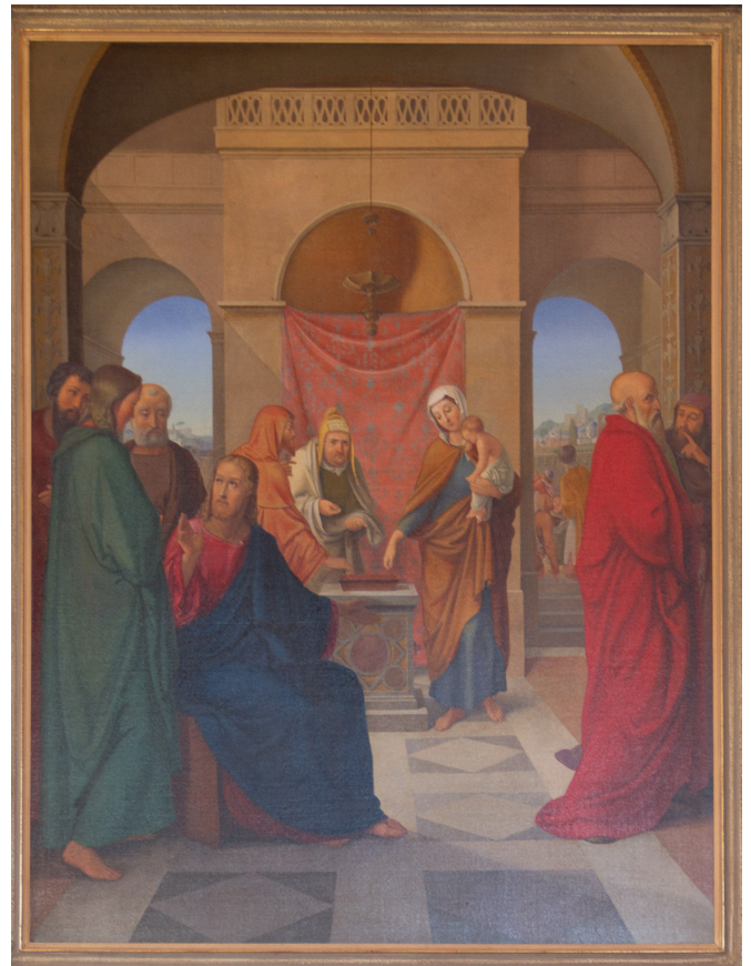
Johann Caspar Schinz, Das Scherflein der Witwe, 1824

Das Kunstmuseum Luzern plante für den Herbst 1985 eine Ausstellung zur religiösen Schweizer Malerei im 19. Jahrhundert. Man wusste um das Bild in Dinhard, ist es doch eines der beiden Schinz-